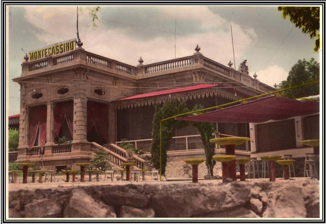
Así se veía el Hotel Montecassino antes de las reformas