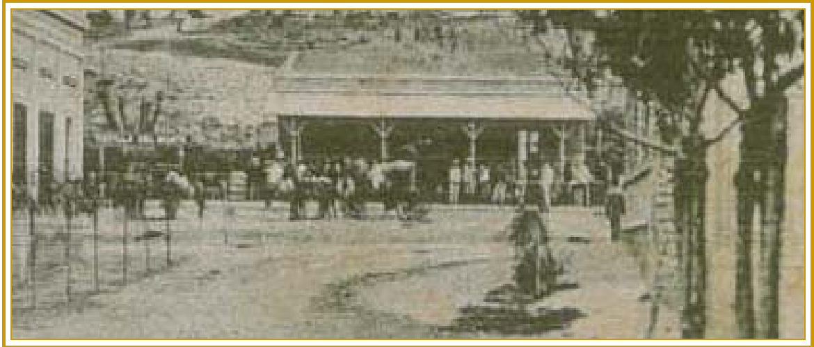
Vista de la Estación de trenes desde la esquina de Diag. Buenos Aires y 25 de Mayo – 1907