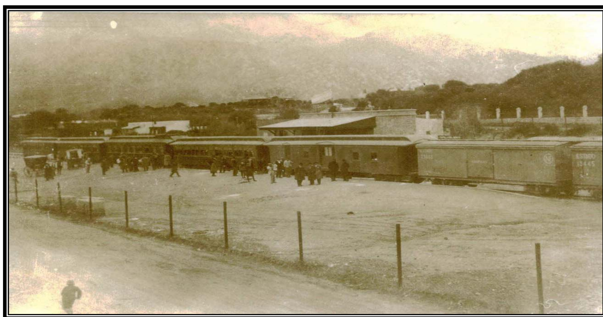
Vista del tren detenido en la estación Capilla del Monte.

Como se observa en la fotografía de época, no existía aun el nuevo edificio y el cuadro de estación se encontraba apenas alambrado. Los carruajes ingresaban hasta los vagones donde descendían los pasajeros. Hoy es utilizado como salón alternativo de usos múltiples del área de Cultura; se realizan allí los talleres de teatro o se dan charlas y conferencias. La parte posterior esta destinada a depósitos del área de Turismo y camarines del predio para espectáculos al aire libre "Gabriel Suárez".