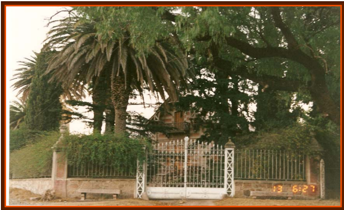
Porton de ingreso sobre calle Pueyrredon